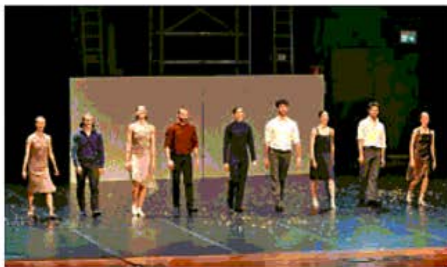
Applausi a scena aperta per i ballerini della MM Contemporary