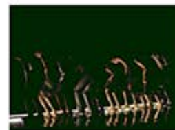
MM Contemporary Dance Company

torbida, disincantata, tormentata da un malessere che si respira nell'aria, ma anche ansiosamente alla ricerca di un senso e di una speranza di felicità. Un lavoro denso di immagini poetiche, che diventano tutt'uno con la musica e ne sposano la ricchezza compositiva legandosi intimamente alla sua inesauribile varietà e a ciò che essa esprime. Nella seconda parte, «Gershwin suite», Merola sceglie la musica di Gershwin nelle sue varie sfaccettature, non solo quindi i brani più euforici e brillanti, ma anche quelli più romantici e intimi, sensuali e seducenti. Salda il tutto una nuova composizione di Stefano Corrias , un tappeto musicale che conferisce unità al ricco mosaico di sentori, ora traboccanti dinamismo, ora pienamente lirici, sospesi nel ripensamento e addensati nella malinconia.