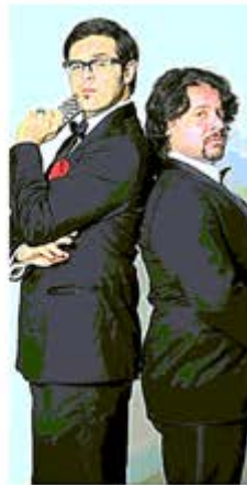
Il duo comico Lillo&Greg

Rimane confermato invece al teatro Maggiore di Verbania l'appuntamento con la danza sabato sera: alle 21 musiche di Schubert e Gershwin per i ballerini della Mm Contemporary Dance Company di Reggio Emilia (bi-