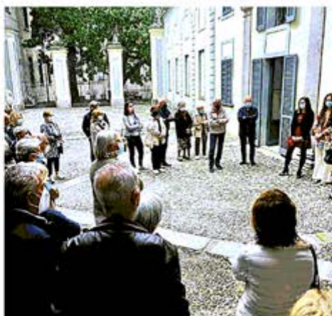
Sabato e domenica al museo del Paesaggio c'è un'iniziativa di Cross

La partecipazione è possibile solo su prenotazione inviando una mail a prenotazioni@museodelpaesaggio.it. Sono disponibili due posti con due accessi all'ora dalle 10 alle 18. Dal 25 al 27 febbraio debutterà invece alla