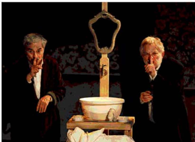
SUL PALCO Massimo Dapporto e Antonello Fassari